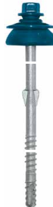
blanke schroef gemonteerd met dichtingsring + boorpunt